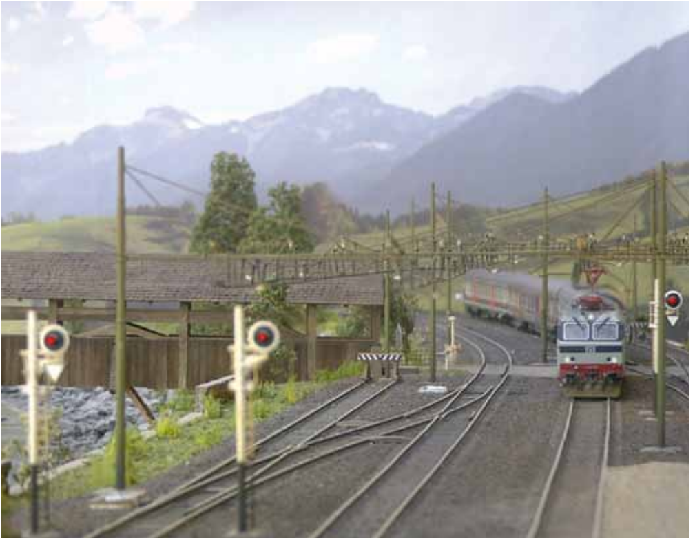
Eine FS E652 mit Regionalzug fährt im Bahnhof Atzwang ein. (Anlage „Brennerbahn“ in H0 des Modelleisenbahnclubs Schlanders)

gefördert von Stiftung Südtiroler Sparkasse Fondazione Cassa di Risparmio sostenuto da